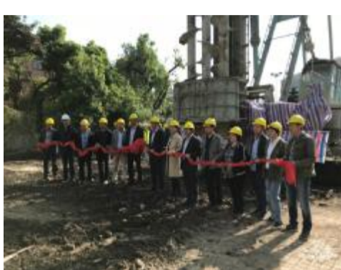
集团杭州第二中学东河校区项目举行开工典礼

4月19日上午,在具有120年历史的杭州第二中学东河校区内,由集团承建的杭州第二中学东河校区求是楼、三好楼新建项目举行了隆重的开工典礼。