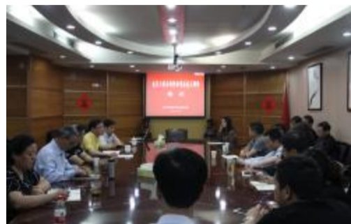
企业解决实际等问题与公司高层领导展开了亲切交谈和热烈讨论。